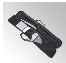
ROBUSTA CUSTODIA IN OXFORD

QUESTO PRODOTTO PUO ESSERE VENDUTO SOLO ABBINATO ALL'ACQUISTO DI BANDIERE