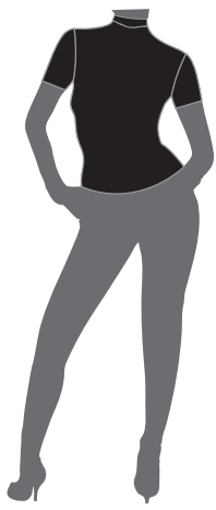
QP POLO MICROFIBRA TRASPIRANTE