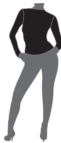
QTL T-SHIRT MANICA LUNGA MICROFIBRA TRASPIRANTE